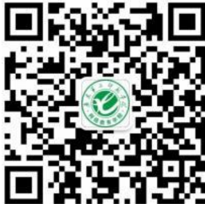
广东二师在线公众号

第二步：进入公众号点击“个人信息—绑定账号”按钮，进入绑定页面，请按要求填写相关信息