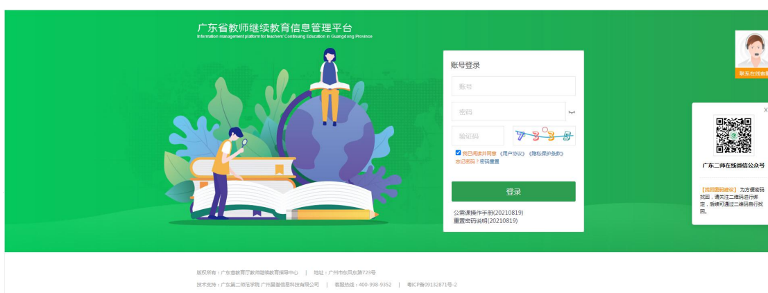
图：广东省教师继续教育信息管理平台